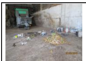
20. Altres aspectes