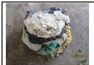
11. Bosses de plàstic