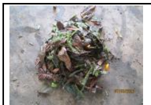
4.2 Fracció vegetal assimilable a FORM