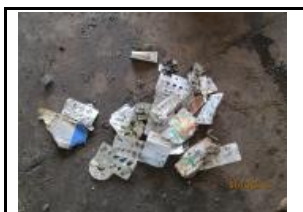
16. Residus especials