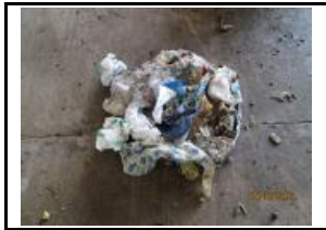
9. Paper i cartró