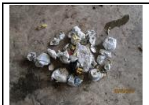
13. Metall no fèrric