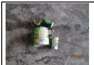
12. Metall fèrric