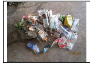
10. Plàstic, mixtos i film