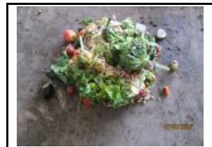
4.1 Malbaratament alimentari FORM