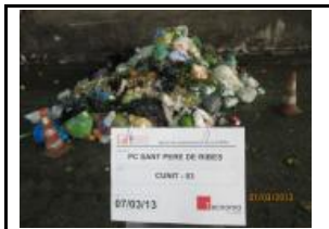
2. Identificació del Lot