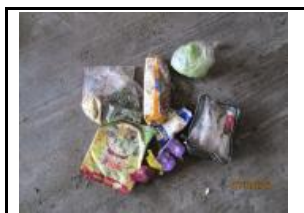
19.1 Malbaratament alimentari Altres