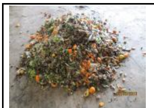
4.3 FORM no inclosa als grups 4.1 i 4.2