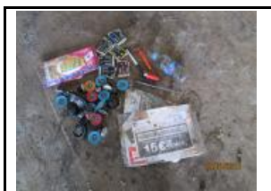
19.2 Altres no inclosos en grup 19.1