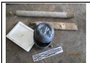
17. Residus voluminosos (trobats al Lot)