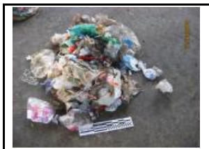
10. Plàstic, mixtos i film