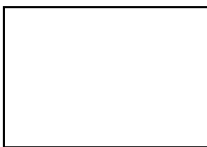
6. Poda voluminosa (trobad a la mostra)