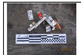
16. Residus especials