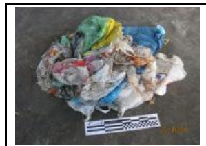
11. Bosses de plàstic