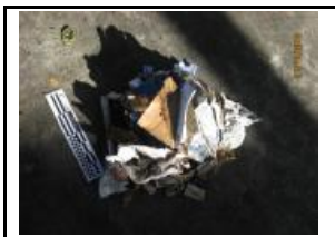
9. Paper i cartró