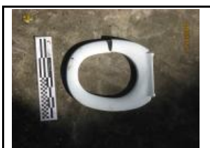
17. Residus voluminosos (trobad al Lot)