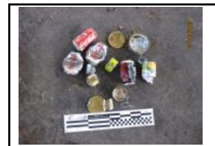
12. Metall fèrric