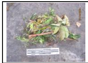
7. Poda no voluminosa (trobad a la mostra)