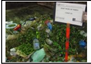
2. Identificació del Lot