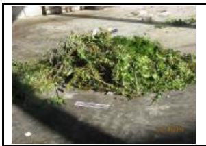
5. Poda voluminosa (trobad a al lot)