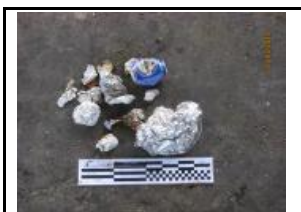
13. Metall no fèrric