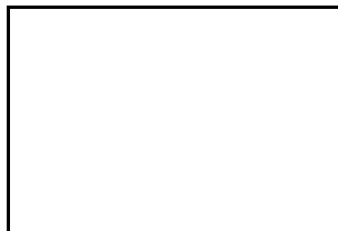
6. Poda voluminosa (trobad a la mostra)