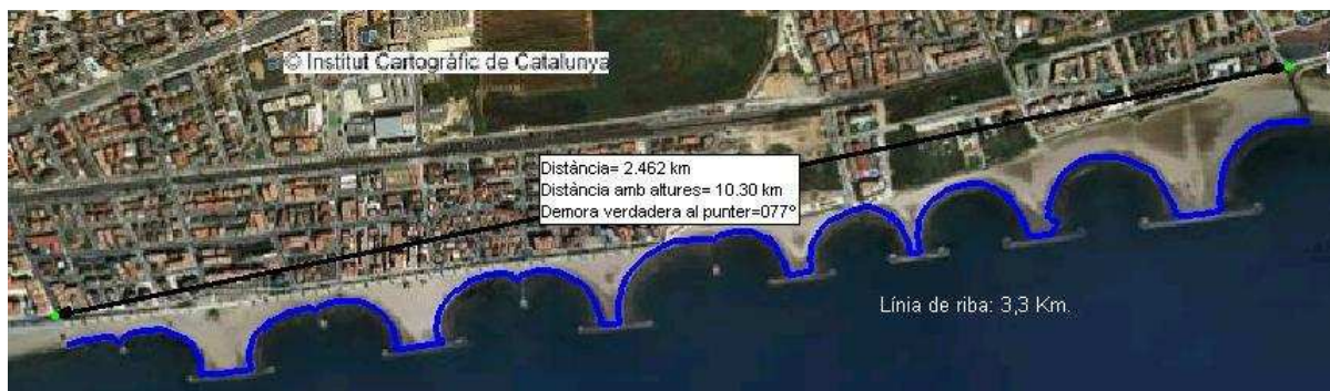
Fig.1-Front Marítim de Cunit.

L'amplada mitjana de la platja se situa en 50 m, tot i que assoleix una profunditat màxima de 237 metres en l'espigó núm. 7 i una mínima que oscil·la entre els 0 i 3 metres, en funció de l'època de l'any i estat del mar, en dos trams, d'uns 50 m al voltant del carrer de l'Estació, i al final de l'Av. de la Font.