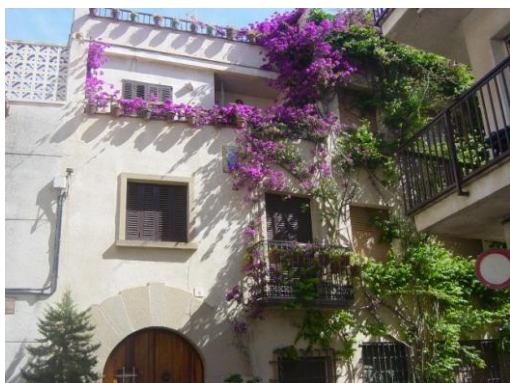
Casc antic de Cunit

Aquest correspondria a tota l'extensió urbana del municipi, des del nucli urbà amb més tradició i que ocupa bona part de la plana litoral, caracteritzat per habitatges plurifamiliars i unifamiliars adossats en filera en la major part de zones i algunes en que predomini els habitatges unifamiliars aïllats; fins les urbanitzacions sense continuïtat amb la trama urbana que comporta variacions de major pendent, més vegetació i amb habitatges unifamiliars aïllats gairebé exclusivament.