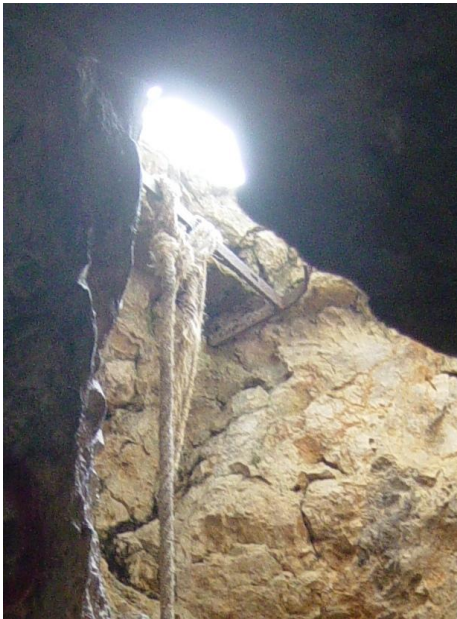
Avenc de Sant Antoni

Es tracta d'una cavitat natural en forma d'avenc, produïda per la meteorització del carbonat càlcic de la roca calcària pel procés de la descomposició per l'efecte de la filtració d'aigua, Malgrat ser un avenc com molts del que hi ha al massís del Garraf, aquest avenc ha sotmès la pressió de la mà de l'home i hi ha constància de la seva existència ja a finals del segle XIX. Actualment té més fisonomia de cova, ja que es va practicar una obertura lateral a primers del segle XX, ja que se'n va extreure terra per fer feixes de conreu al seu voltant, com així ho testimonien els marges de pedra seca que l'envolten, va servir de bodega i també s'hi van conrear xampinyons. Consta de 3 galeries, amb una longitud màxima d'uns 40 m., una de principal i 2 secundàries. Hi habiten ratpenats, una espècie protegida de fauna autòctona. S'hi troben restes de formacions calcàries, com estalactites, estalactites i columnes, tot i que força deteriorades i espoliades per l'acció de l'home.