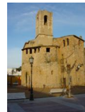
Església de St. Sebastià.

L'element més destacable del Cunit urbà és l'absis de l'església parroquial de Sant Cristòfol, que datada del segle XIII amb el seu característic campanar no pas d'estil romànic sinó més aviat gòtic. El seu emplaçament i la urbanització de la Plaça Catalunya realcen l'estructura de l'edifici i el fan l'element patrimonial més destacable del municipi. Altres indrets d'interès paisatgístic són alguns racons del casc antic com la Plaça de Sant Sebastià.