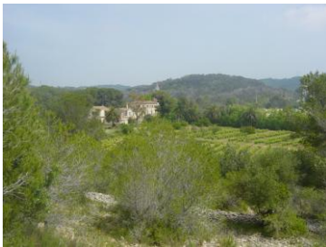
Paisatge agroforestal típic de Cunit, prop de cal Pla.

També destaca en aquest sector el jaciment Ibèric del Fondo del Roig descobert arran de la construcció de l'autopista C-32 i que s'ha conservat donat el seu interès.