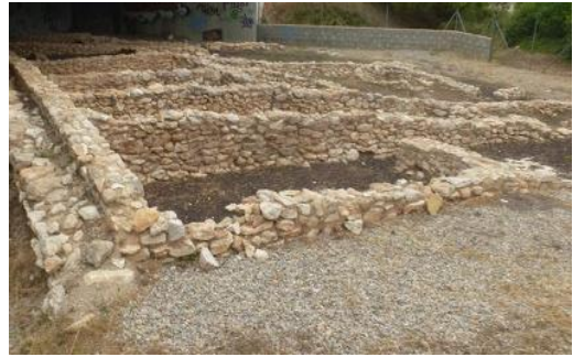
Jaciment iber Fondo del Roig, s. I dC.

Descobert a finals de l'any 1995 durant els treballs de desbrossament per la construcció de l'autopista Pau Casals es va trobar aquest jaciment ibèric que data del s. III aC. El podem incloure com element d'interès paisatgístic i es troba en la zona de conreus del marge oest del terme. Es va procedir a preservar amb una elevació i lleugera modificació del traçat de l'autopista, amb la construcció d'un mirador per poder visitar-lo sense entrar directament en el seu àmbit per facilitar-ne la seva conservació.