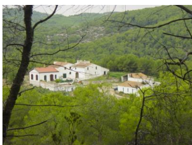
Masia de Puig de Tiula

Es tracta d'uns elements de gran valor patrimonial i paisatgístic. La major part d'elles estan identificades i catalogades com a elements patrimonials a protegir i conservar. La seva tipologia es diversa i variada, ja que els usos a que estaven destinades també són diferents. Els estils van des de la tradicional masia catalana, estil a la que pertanyen masies com Cal Torrents, Cal Santó, Puig de Tiula o Vilaseca fins a masies d'estil colonial, com és el cas de la masia de Cal Pla.