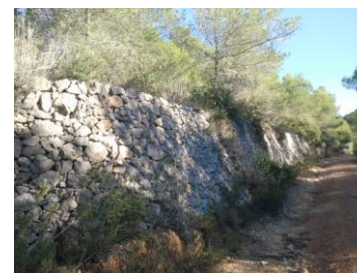
Mur de pedra seca fondo de l'Avenc

Es tracta de construccions de pedra seca, algunes de gran extensió i altura, que tenien la finalitat d'aconseguir terrasses pel conreu en els vessants muntanyosos per tal de reduir el fort pendent. Els de major interès es troben al besant sud del Turó de l'Avenc, en que tenen una altura de més de 2 metres i una extensió considerable. Alguns d'ells es troben en molt bon estat de conservació i proliferen arreu del municipi. Són un element que es troba identificat i catalogat en el POUM de Cunit.